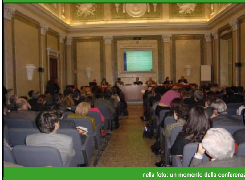
nella foto: un momento della conferenza

Oltre 200 mobility manager, amministratori locali ed esponenti del governo si sono incontrati per fare il punto della situazione, scambiare esperienze, proporre nuove soluzioni e fare precise richieste