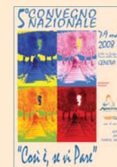
5° CONVEGNO NAZIONALE Genova 2008